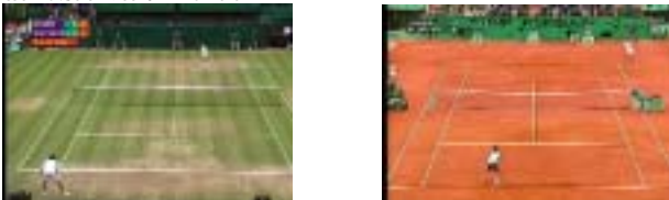
図2： 競技開催場所による主要色の異なる場合 左：(緑色の芝コート) 右：(赤土のクレコート) Fig. 2 Difference of Dominant Color Information

を棄却不可能となり、分析した両者のカメラワーク情報に有意な差がないことが確認できる。つまり会場や時間帯等の撮影環境の違いがスポーツ中継番組映像のカメラワーク情報の統計的解析結果に影響していない。