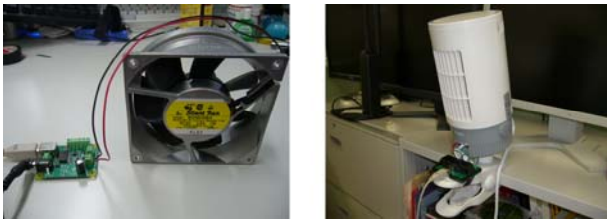
図1 送風ディスプレイのプロトタイプ Fig.1 Prototypes of Blow Displays

ように改造したものである。扇風機は小型・縦長のシロッコファンで、3段階の風量調節ができる。